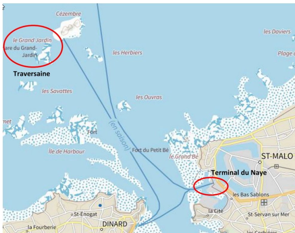
Figure 1: Chenal de l'avant-port de Saint-Malo (extrait de l'étude d'impact)