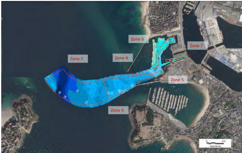
Figure 3: Localisation des zones de dragage et de déroctage du chenal (extrait de l'étude d'impact)

L'extension du panache de turbidité 16 lié aux travaux a fait l'objet d'une modélisation numérique sur la durée estimée des travaux. Les résultats montrent que les concentrations les plus importantes (supérieures à 15 mg/l) se limitent à l'avant-port et au droit des zones draguées, avant de se dissiper vers le large et vers l'estuaire.